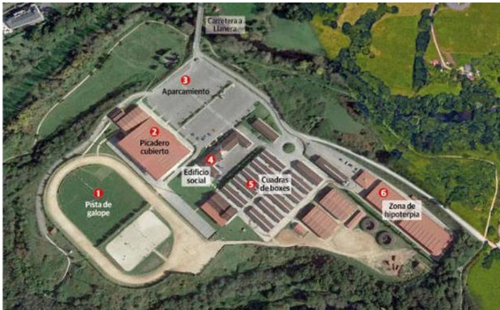
Imagen de las instalaciones

El organigrama de la asociación se distribuye de la siguiente manera: