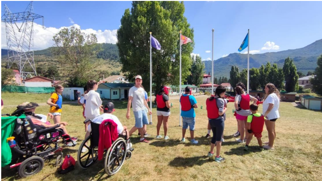
Imagen de los participantes del campamento en la actividad de paintball.

El resultado del campamento fue muy positivo, todos los padres y niños quedaron muy contentos con la actividad y su organización. Para algunos de los participantes era la primera vez que se separaban de sus padres por una noche o más y esto nos hace ver la confianza que depositan en nosotros para poder hacerlo.