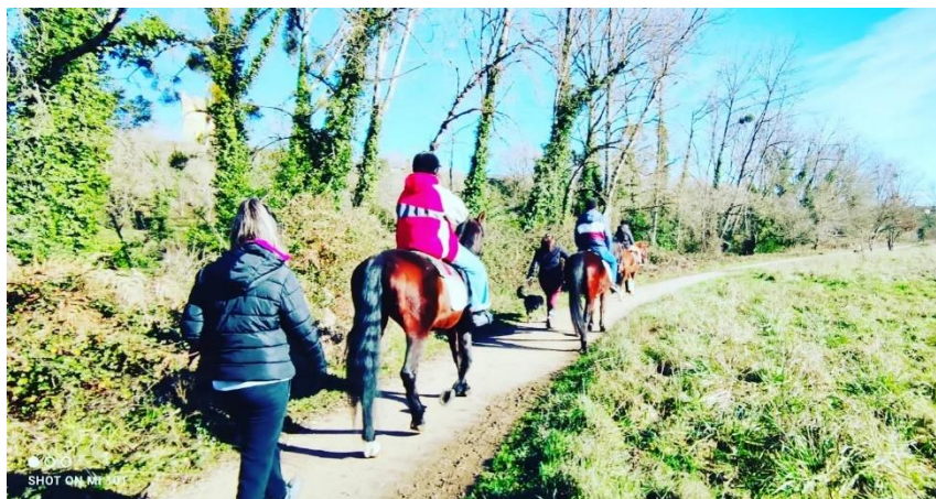
Imagen de personas con trastorno mental grave realizando terapia ecuestre.

A día de hoy ya tenemos confirmación de la prórroga de este proyecto para el año 2024.